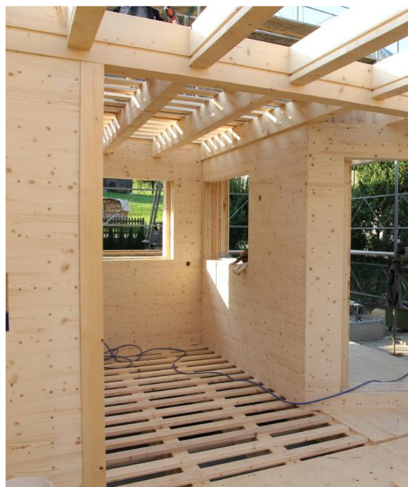
Systeme en bois massif

NON, il n'y a pas pénurie de bois de construction.