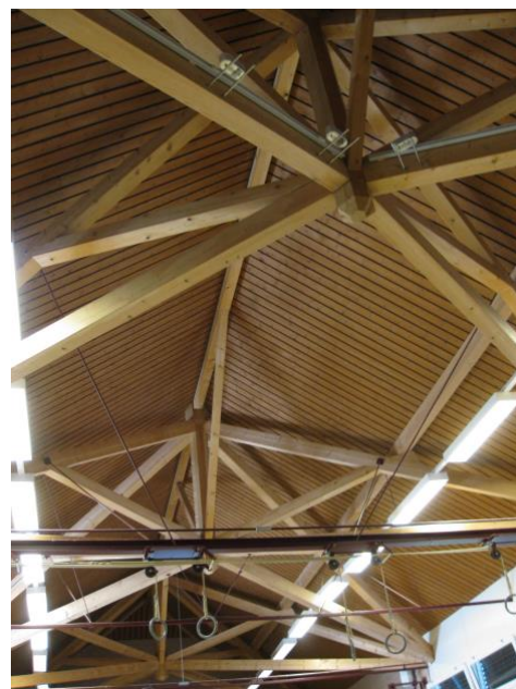
Charpente en bois massif Grande salle de Juriens

La pénurie ne concerne que les « produits en bois lamellé-collé et les panneaux, tous les autres produits restant disponibles » comme l'écrit la plus grande scierie suisse Schilliger Holz AG à ses clients. Ces produits de construction sont issus d'abord de grandes unités industrielles, dont beaucoup hors de Suisse (en Allemagne, en Autriche), basés en priorité sur des petits bois d'épicéa. Depuis 2008 (crise des subprimes) ces industries avaient