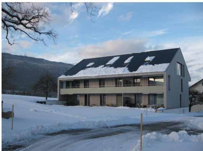
Immeuble locatif à La Rippe, totalement bois massif-sapin blanc

perdu leur marché aux Etats-Unis et avaient inondé le marché européen avec leurs produits à prix plancher (le prix du lamellé-collé a été divisé par 2). Dès lors, avec leur force de frappe, ces produits stables, standards, bon marché et livrables rapidement sont devenus la matière première de base des constructeurs en bois, du concepteur au charpentier en passant par l'ingénieur. Aujourd'hui, 60 à 70% du bois de construction en Suisse provient des pays voisins.